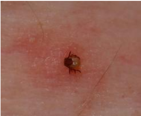
3. Căpușă care s-a fixat pe piele