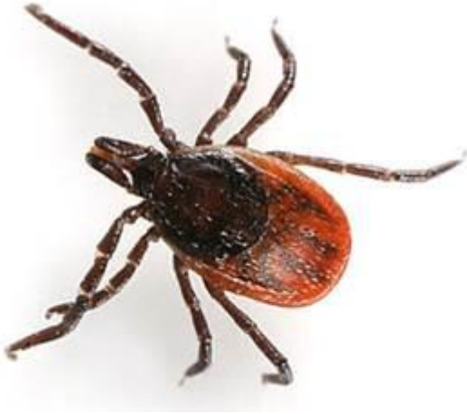
1. Imagine căpușa IXODES