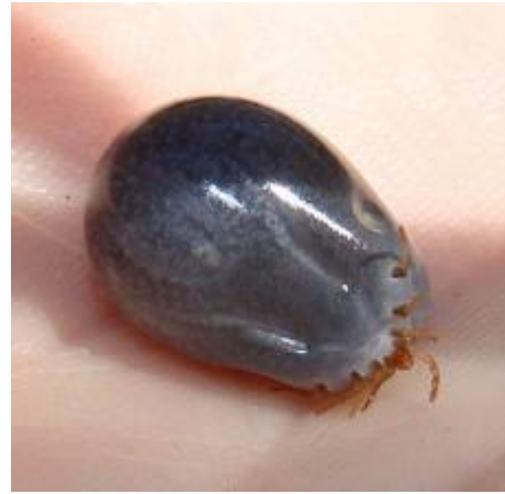
2. Căpușa după ce s-a hrănit